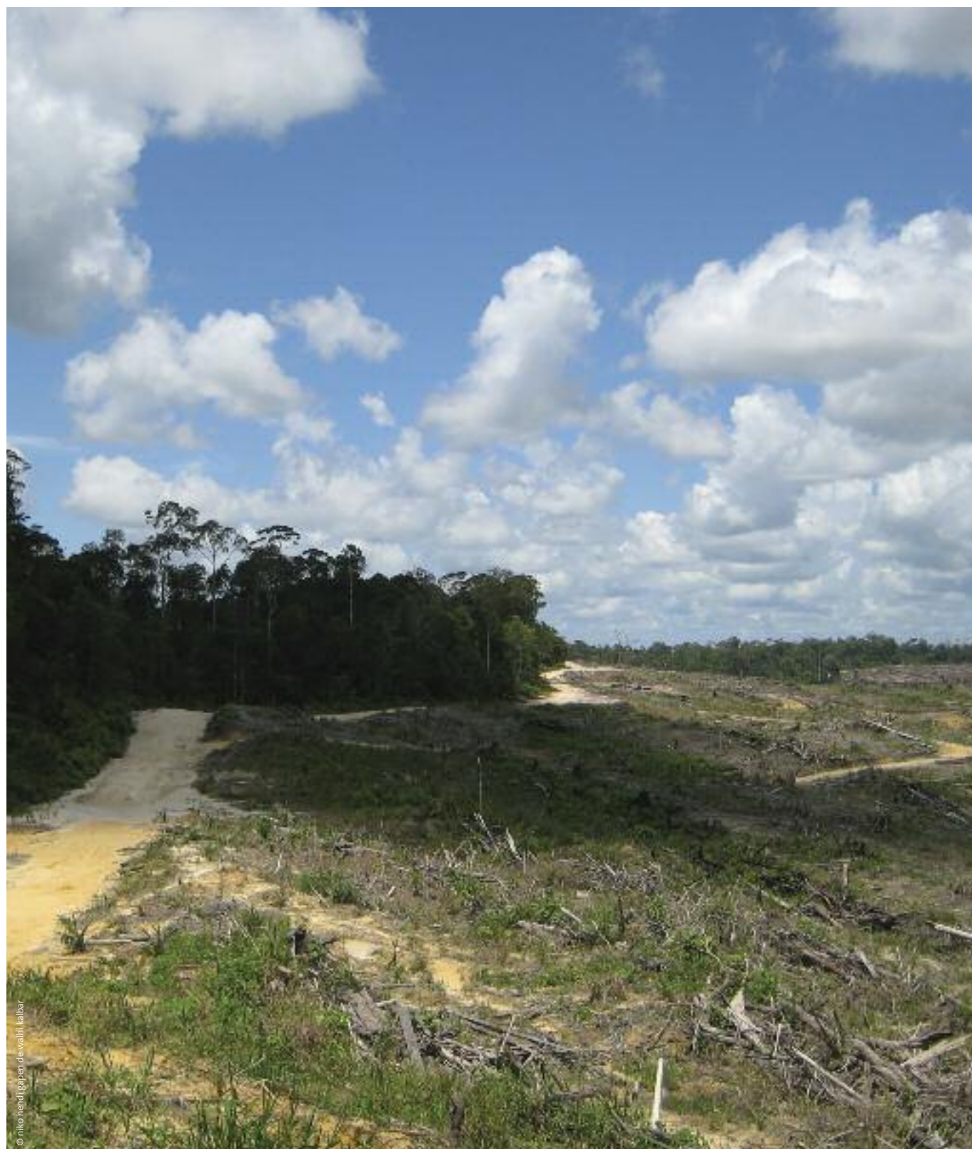
Monocultivo de palma aceitera, Kalimantan Occidental.