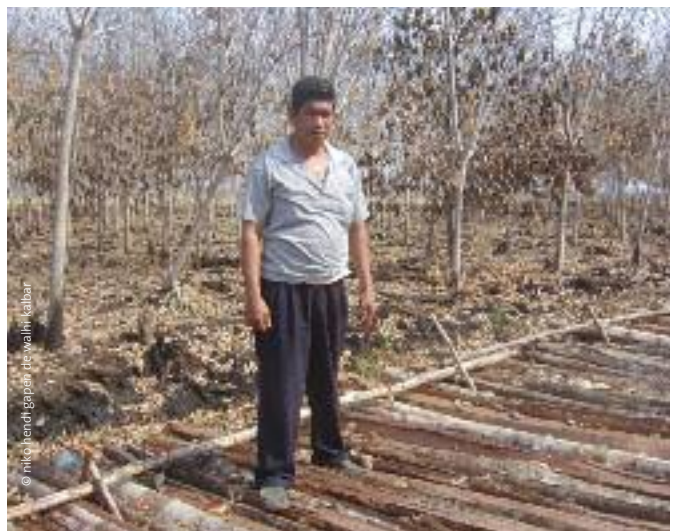
Cultivos campesinos de caucho quemados ilegalmente por una empresa de palma aceitera en Kalimantan Occidental, 2008.